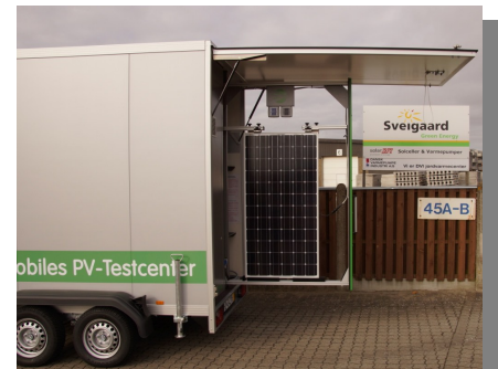
Sveigaards MBJ Testcenter