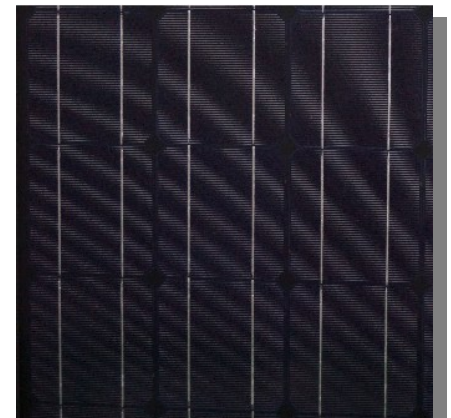
There's more to it - than meets the eye. Panelet har ingen synlige skader